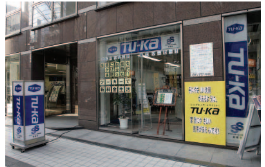
システムステーション様は神奈川県下で、もこ株式会社様を含め8店舗を展開しており、各店舗では携帯通信機器の販売とサポートを提供している。写真はツーカーショップ新横浜店