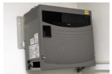
音声とデータを一つのIPネットワークに統合する「Aspire」本体。店舗間のIP内線をはじめ、ネットワークの一元管理を実現している

この課題に対しNECインフロンティアは、VoIP化による店舗間の無料通話に着目。音声とデータを統合したIPネットワーク網の構築を提案し、コストの削減をシステム全体で考えるというスケールアップの手法を説明しました。この提案は、店舗間の電話料金の削減を検討していた同社のニーズともマッチし、2004年4月、音声とデータを統合したIPネットワークの導入が決定されました。同年6月、これまでの提案力と柔軟な対応力を高く評価され、音声通話サービスにKDDI-IPフォンと「Aspire」が選ばれ、同年8月には本社と8店舗間での本格運用が開始されました。